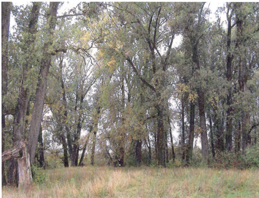
Рисунок 1 – Насаждения черного тополя (осокоря) у с. Чаинск

Наиболее приближенная к с. Чаинск группа тополей вытянута вдоль берега протоки Чаи под углом к реке. Вследствие того, что Чаи и протока посещаются рыбаками, подлесок в местах наиболее частого пребывания людей отсутствует. Напочвенный покров в этой части тополевого массива от мелкотравного до бурьянистого высокотравного.