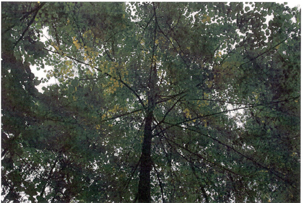
Рисунок 4 – Крона липы