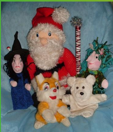
Кукольные герои сказки