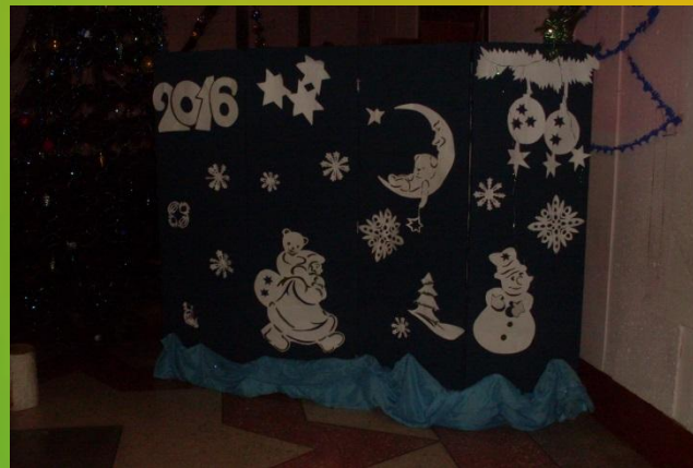
Декорация кукольного театра «Страна СКАЗОК»