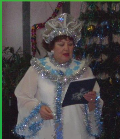
Зима - ведущая программы