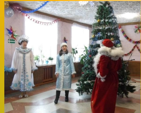
Снегурочка и Зима встречают Деда Мороза