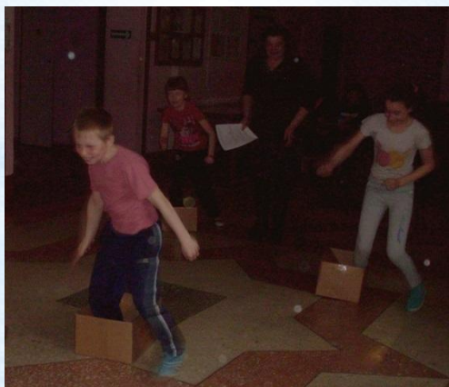
бег в картонных ящиках