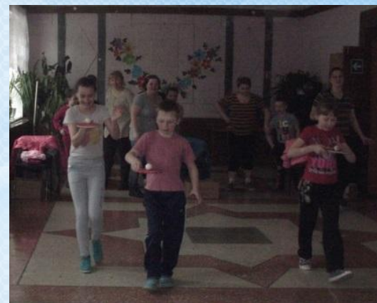
перенесение теннисного шарика